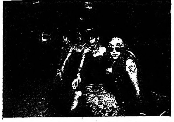
فريق لجنيد: الروك جزء من الثورة على التكنولوجيا... انها عودة الى سرعة الروك... وبعضهم يقول انها العودة الصارخة...